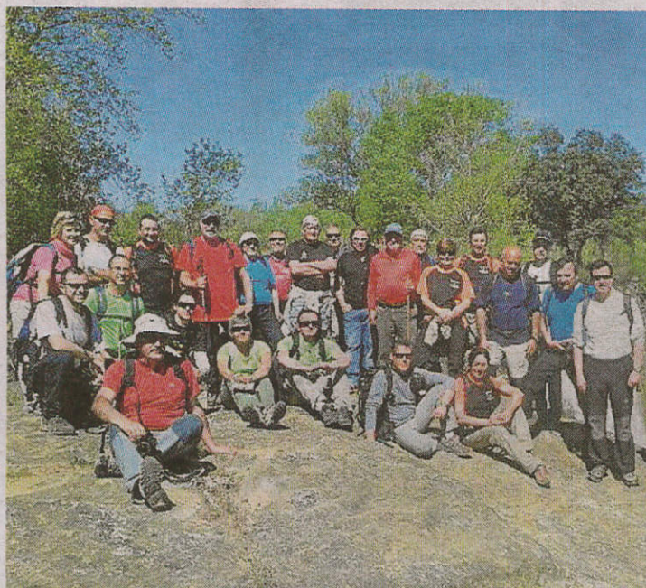
Encuentro de clubes de montaña de la provincia de Huesca. PRAMES